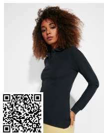
ESTRELLA WOMAN L/S PO6636