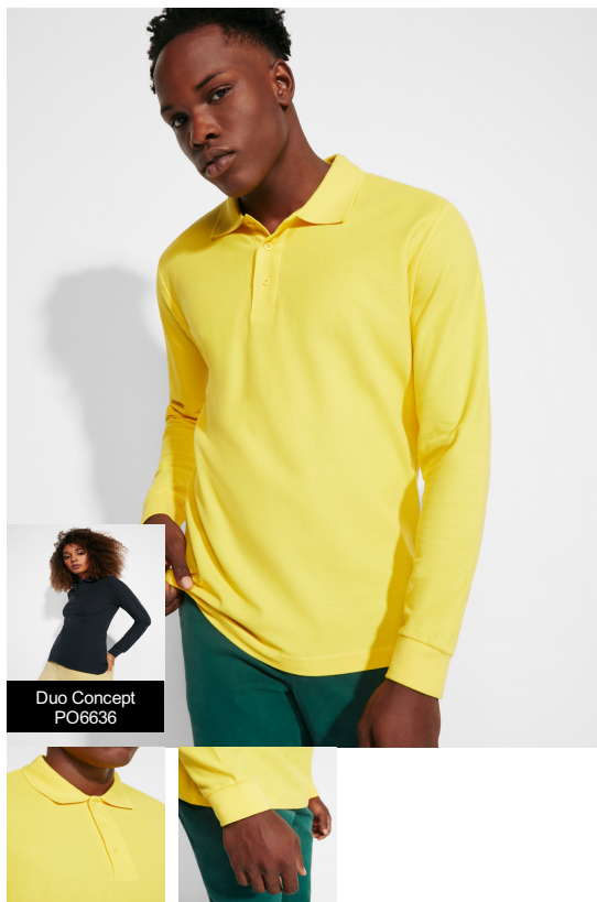
Duo Concept PO6636