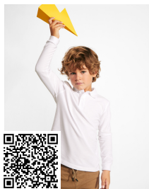
CARPE CHILD PO5008